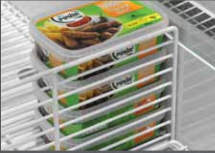
Tel Ara Bölücü / Wire Product Divider