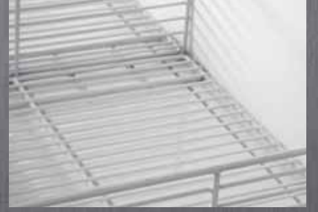
Tel Taban / Wire Base