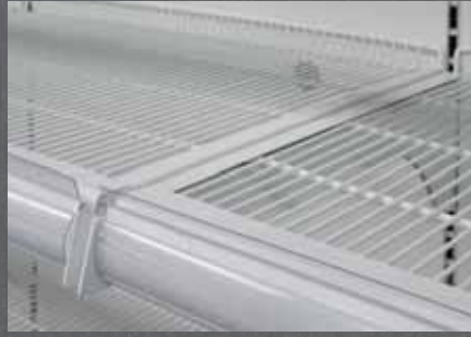
Tel Raf / Wire Shelf