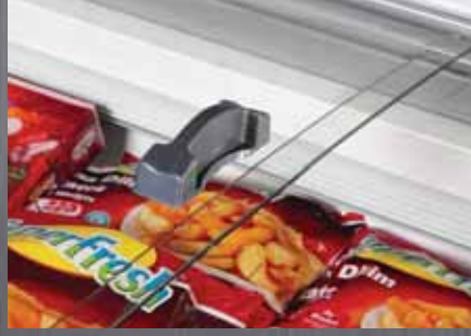
Cam Sürgü / Glass Sliding Cover