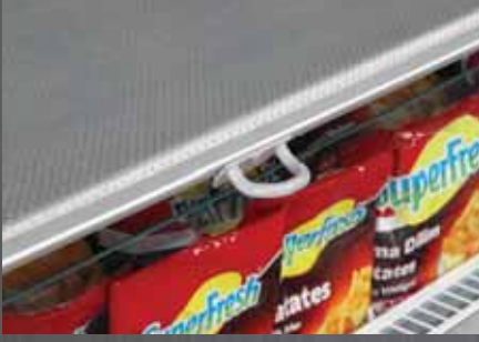
Gece Perdesi / Night Blind